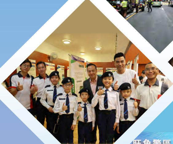
旺角警區「智·悠·衡」 合作商戶——銀行 中國銀行(香港)有限公司