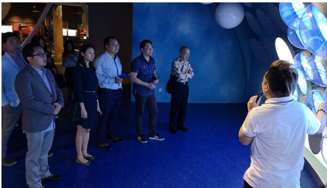
外訪團成員在新加坡濱海堤壩參加當地的導賞團

根據當地導賞團導遊的介紹，新加坡有九個儲水系統，亦有向馬來西亞購買食水。若馬來西亞日後停止向新加坡供水，新加坡就需要為水資源自給自足作準備。因此，新加坡已居安思危，其新生水(NEWater)的發展能夠更好地利用水資源、太陽能及雨水。