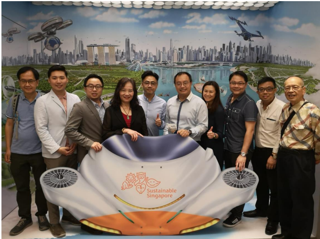
外訪團在新加坡濱海堤壩的展覽館內合影

外訪團認為，在水資源等可再生資源的長遠規劃方面，香港似乎有點落後。香港需向內地購買食水，而香港的土地短缺問題亦阻礙了可再生能源的發展。油尖旺區屬於市區，故可再生能源設施未必適合在本區發展，但香港應利用天然優勢，發展太陽能設施，為未來供電作長遠的考慮。