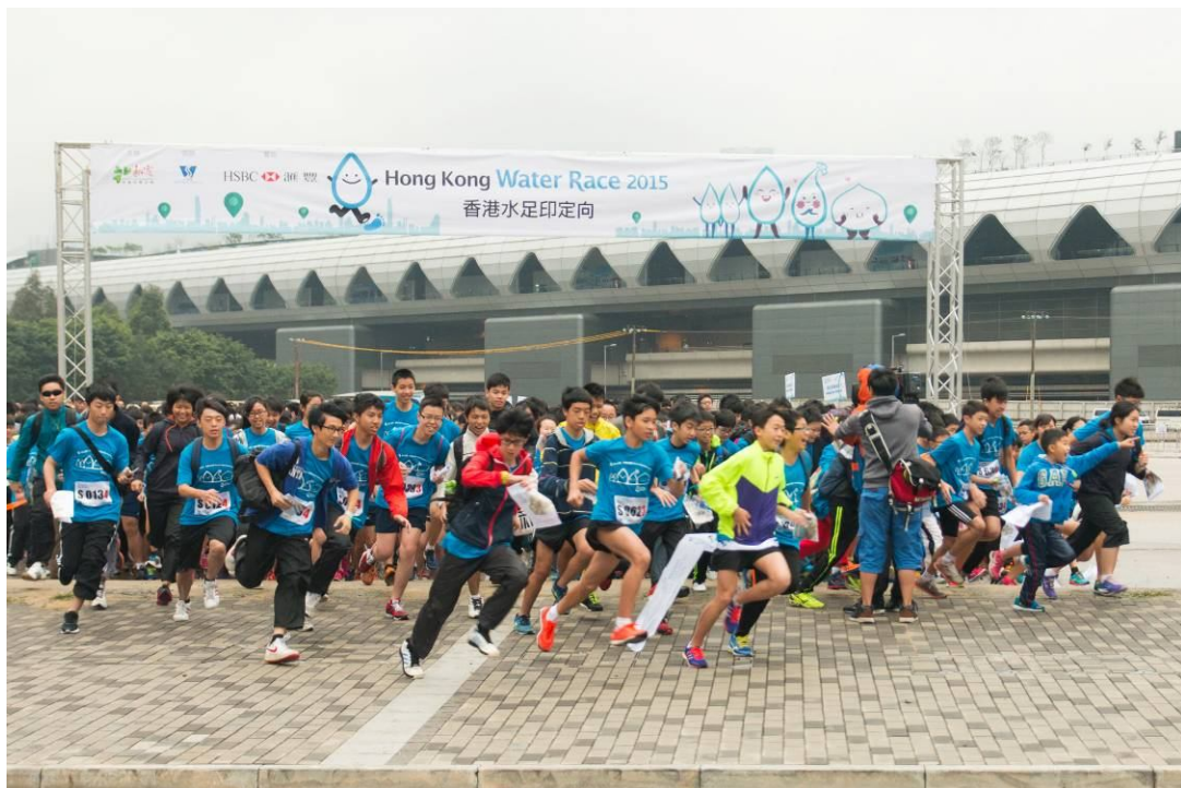
城市定向比賽開始