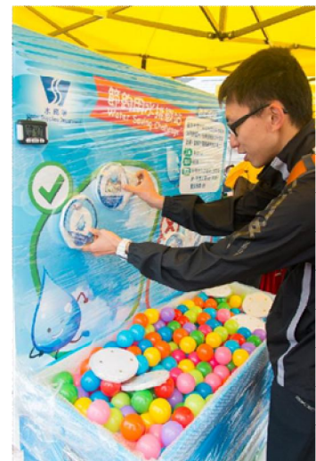
小型嘉年華表演 及 攤位遊戲