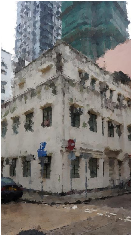
12 SCHOOL STREET