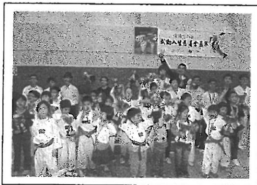
全港十八區武動人生慈善金盃賽 2012 部分得獎學員賽後合照