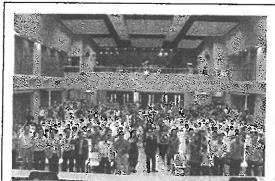
香港青少年獎勵計劃 台下大合照