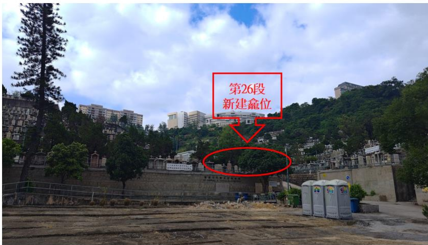
P3. 從墳場入口附近遠眺