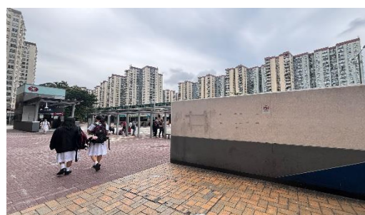
圖二 美孚 A 出口（升降機出口）