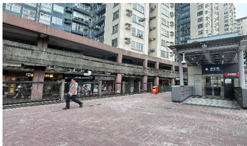
圖三 在升降機出口加建便民行人斜道

2.通過打通港鐵美孚站 A 出口的升降機位置旁圍欄，加建一條連接美孚新邨第二期和萬事達廣場的便民行人斜道。