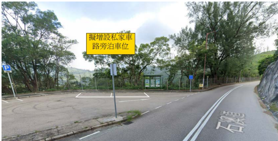
石澳道增設路旁泊車位