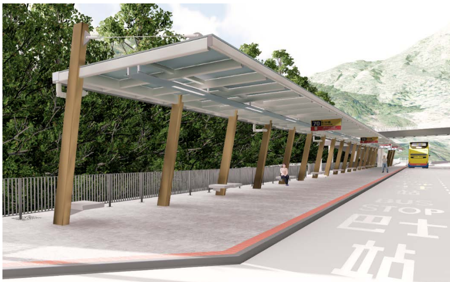
香港仔隧道巴士轉乘站（北行）