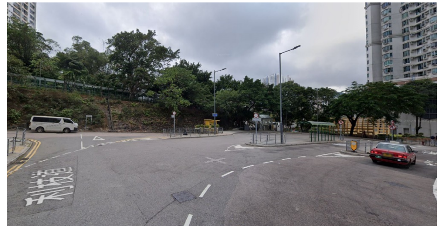
利民道增設路旁泊車位