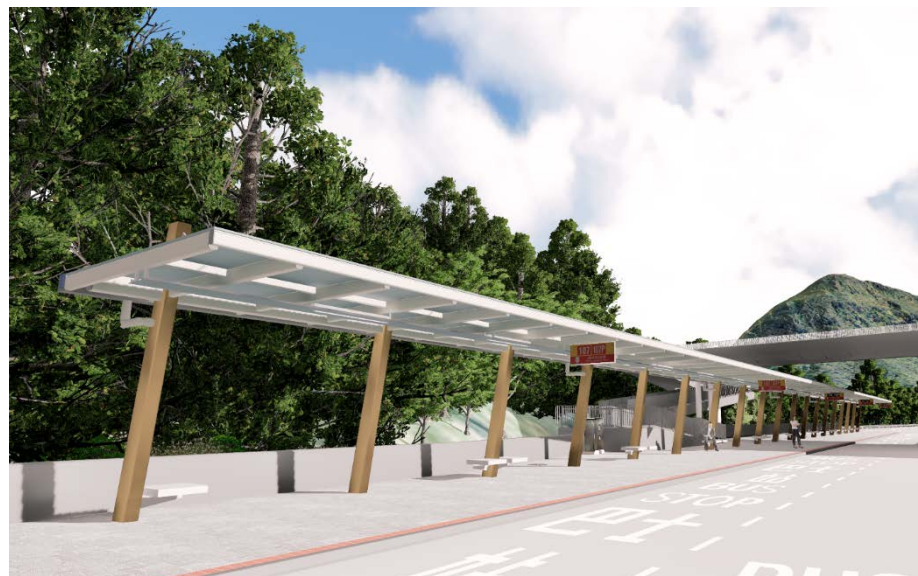
香港仔隧道巴士轉乘站（南行）