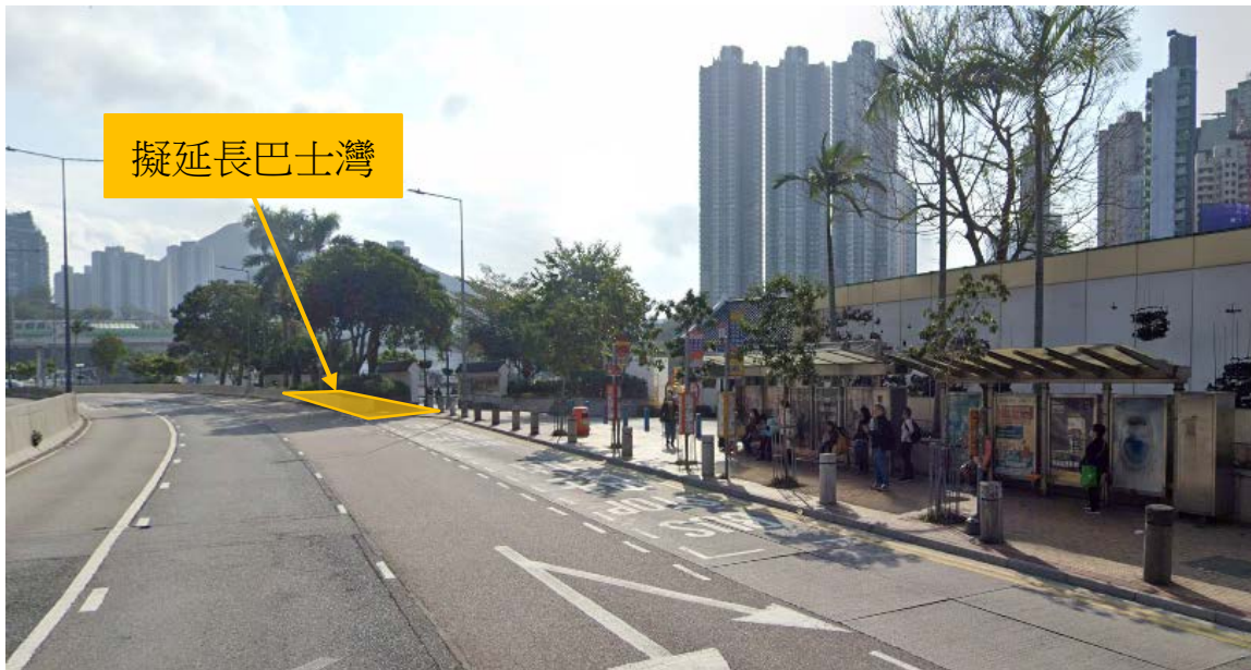
香港仔海傍道近香港仔海濱公園巴士灣