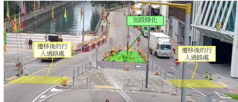
改善後行人過路處