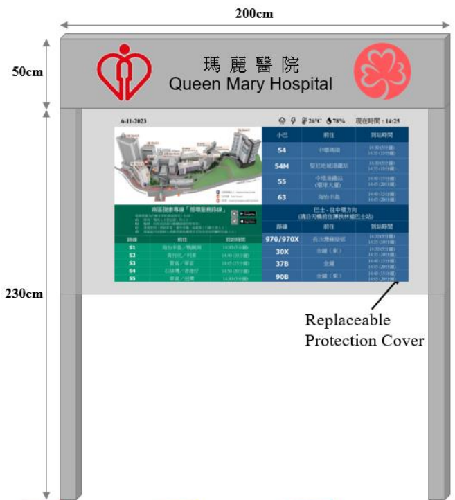
資訊顯示屏設計(初步) Information Display Board Design (tentatively)

More signboard and large display screen would be installed at the public transport terminus area in Block S of Queen Mary Hospital to help service users identify the stopping points and show the arrival time of each public transport and each route of SDRA. HKSR will continue to discuss relevant details and technical issues with the hospital, and it is expected to be completed by the middle of the year.