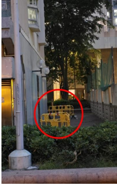
附圖 7: 樹木枯萎多年而未有補種