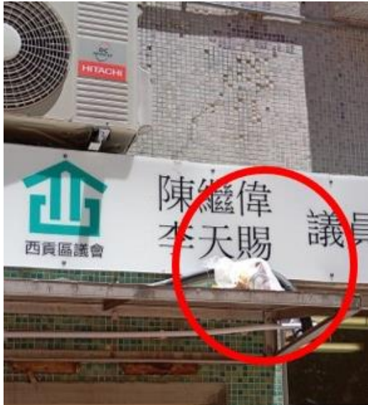
附圖 1: 健暉樓議員辦事處樓上經常有人高空擲物