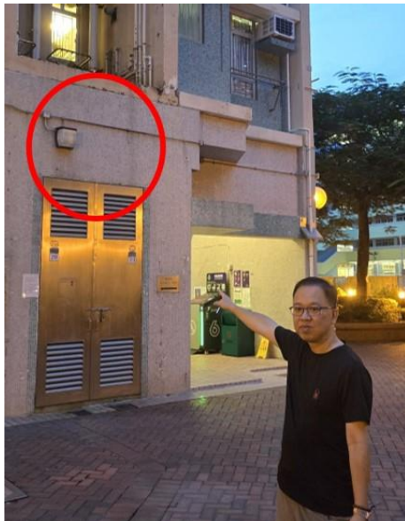
附圖 3: 健明邨公共地方照明燈故障