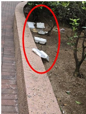
附圖 5: 健明邨花槽滿佈垃圾