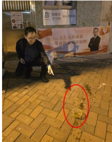
附圖 2: 健暉樓議員辦事處樓上經常有人高空擲物