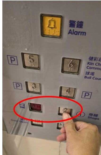
附圖 8: 升降機按鈕經常故障