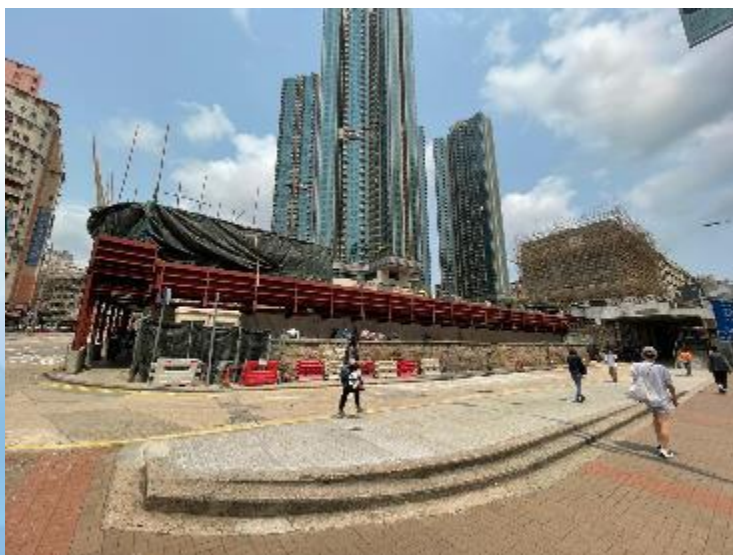
裕民坊2-12號 (拆卸接近完成)