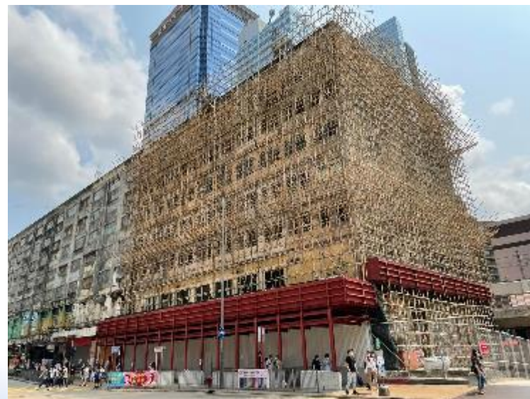
國泰大樓 (準備拆卸)