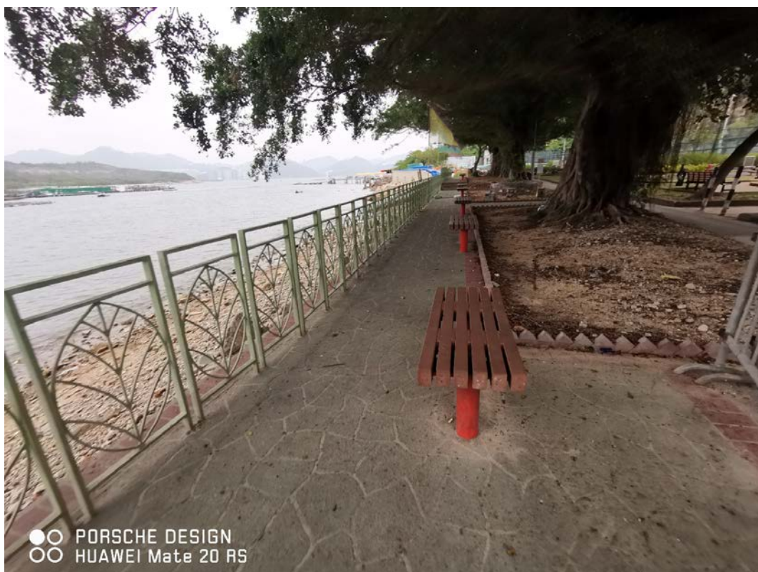
附圖十四：現場圖片 C2