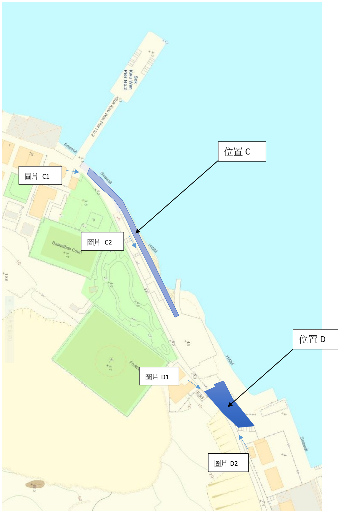
附圖十二：工地位置圖 2