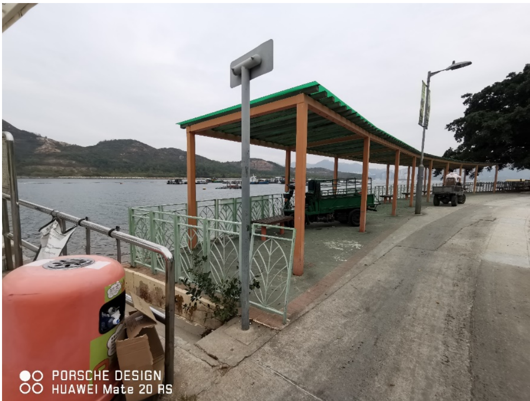
附圖十三：現場圖片 C1