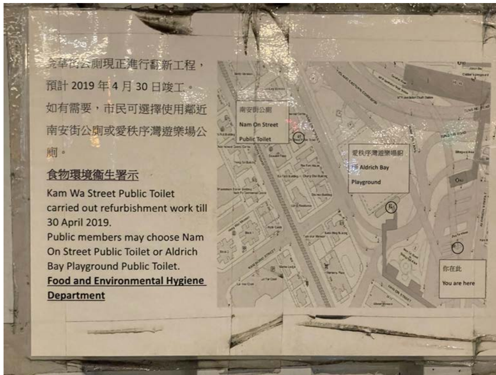
在筲箕灣巴士總站其中一張過時的通告。