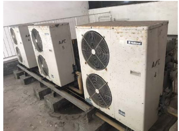
現有室外機裝置 (二)