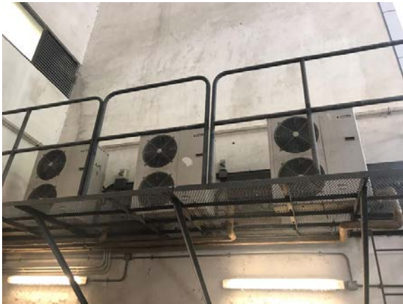
現有室外機裝置 (一)