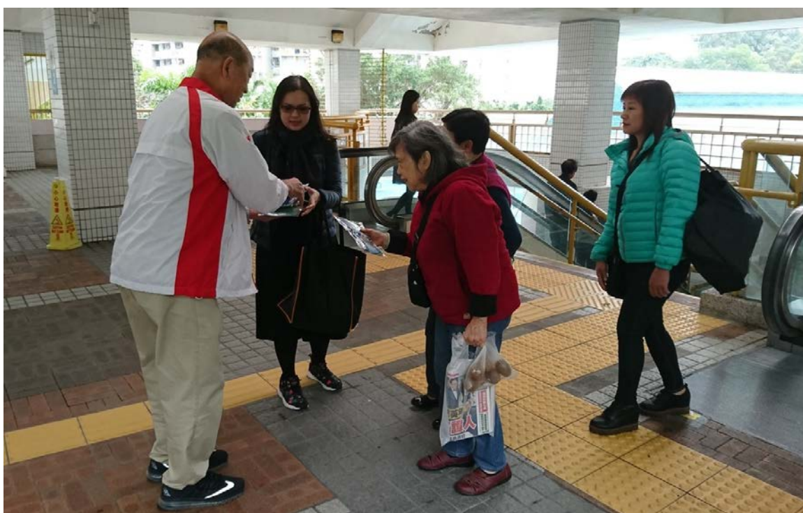
趙資強副主席（左）於筲箕灣耀東邨向市民派發紀念品，受到市民熱烈歡迎。（2017 年 1 月 10 日）