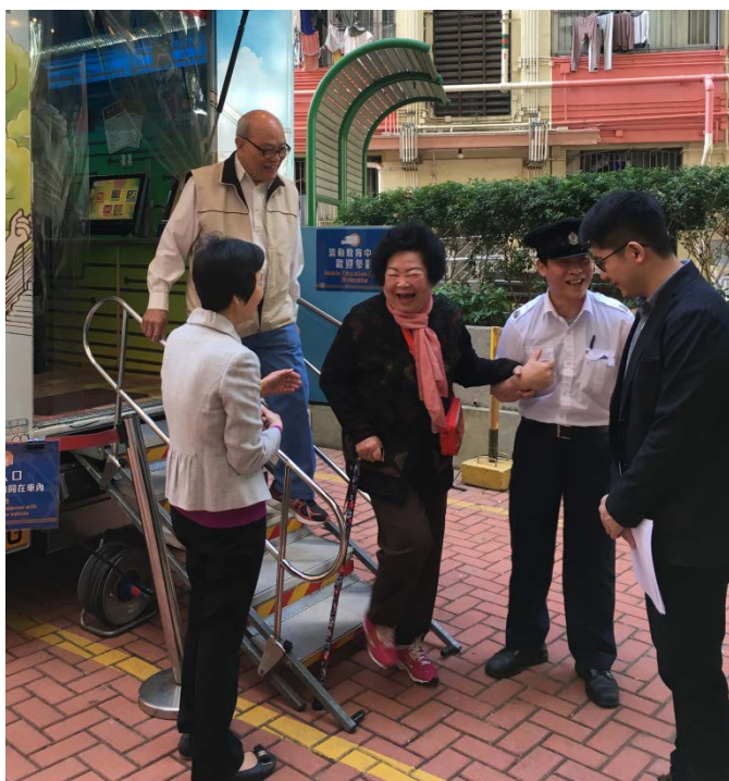
在北角模範邨的流動展覽，深受市民大眾歡迎。 (2016 年 12 月 19 日)