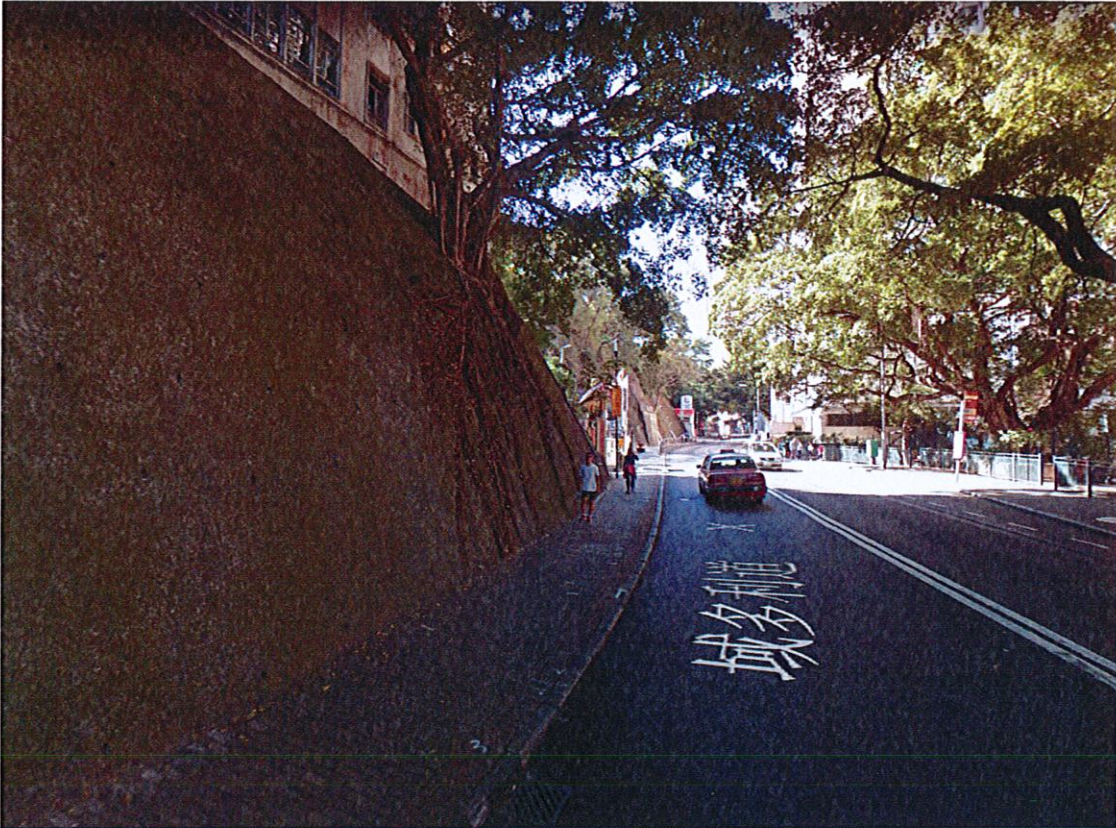
域多利道55號Bayanihan至道慈佛社一帶行人路建議增設防護欄