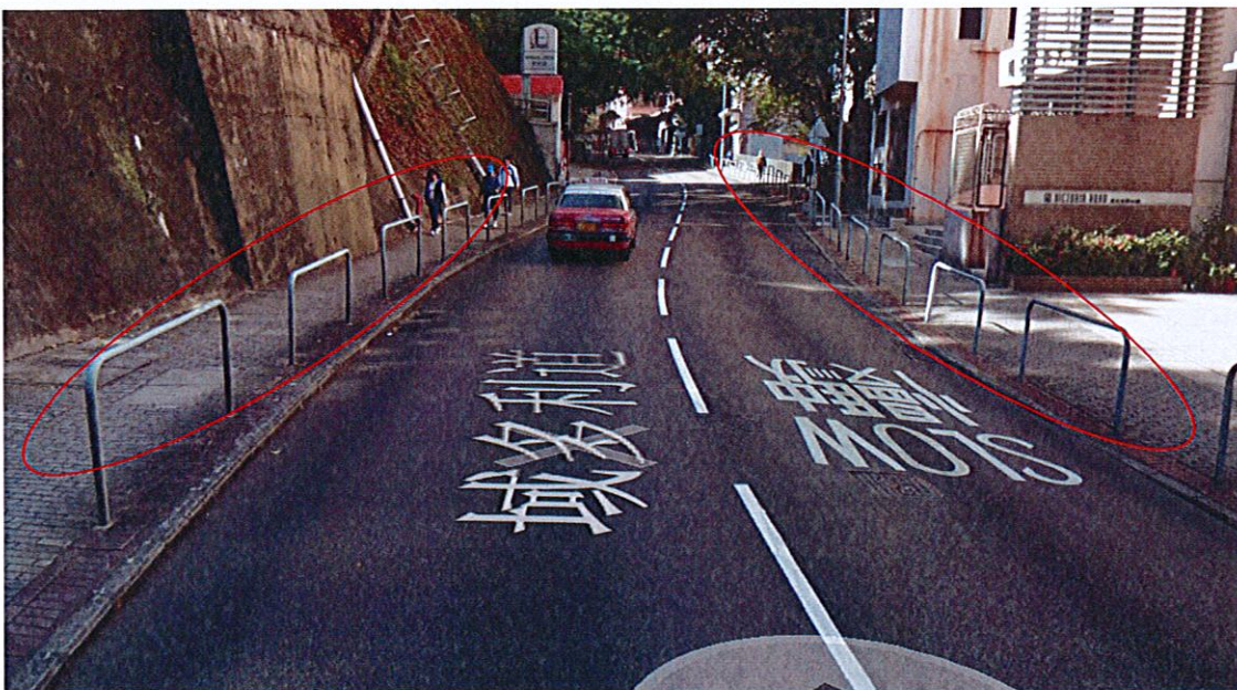
域多利道60號至域多利道80號麗景大廈2邊行人路是U型欄杆 建議更換成為間條型防護欄