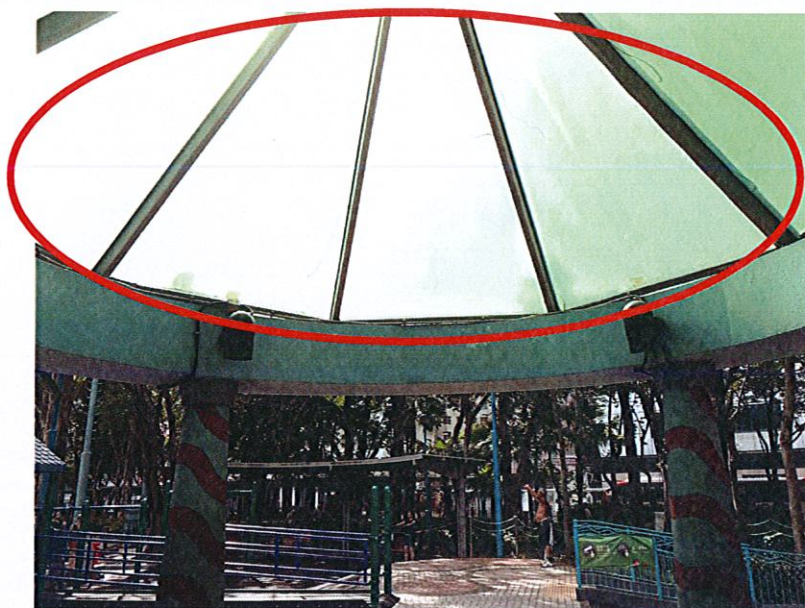
涼亭頂透射陽光，令到亭內溫度上升。附件二