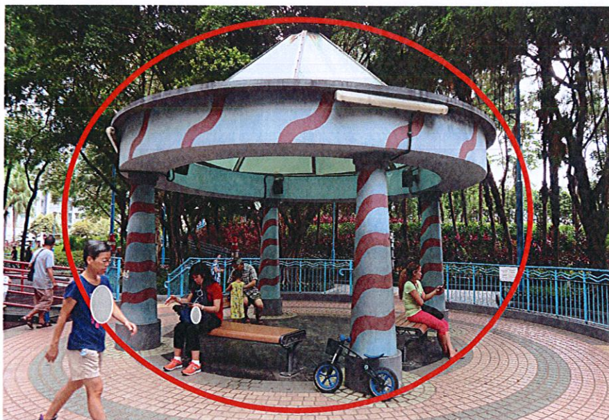
涼亭頂透射陽光，令到亭內溫度上升。附件二