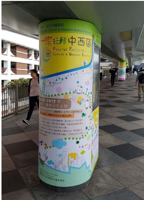
社區重點項目計劃