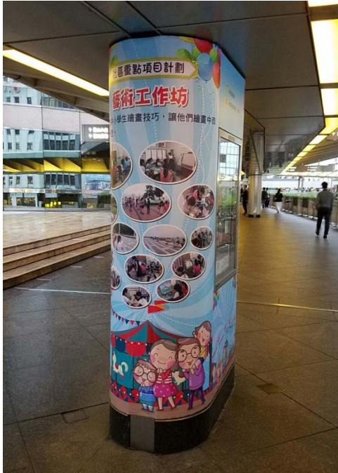
社區重點項目計劃