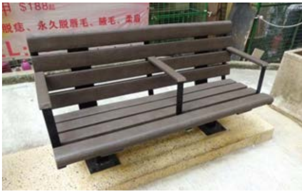
TYPE A：有椅背座椅 (椅腳需要鑲入地底)