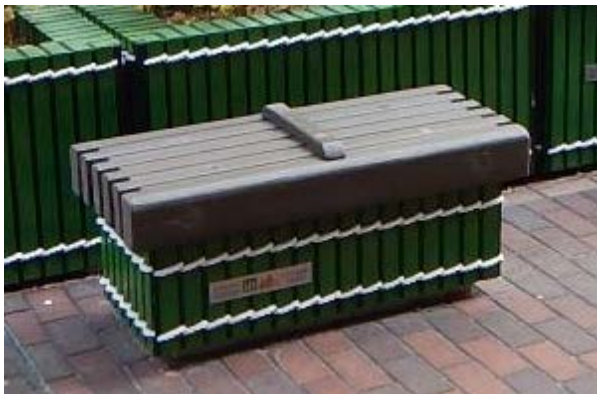
TYPE B：座地式座椅 (椅腳不需鑲入地底)