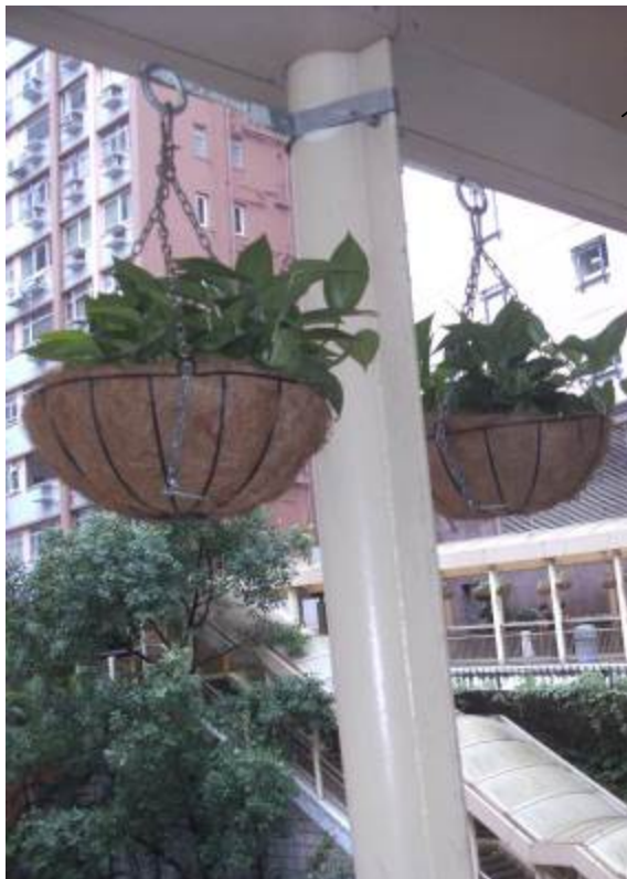
懸垂式花籃植物 式樣參考