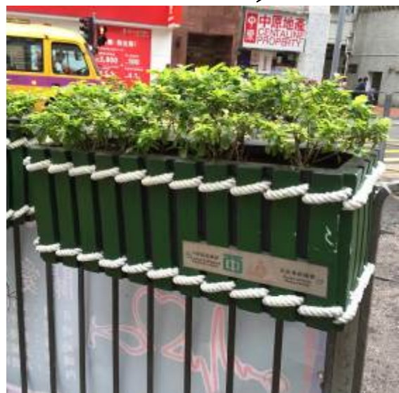
欄杆盆栽植物 式樣參考