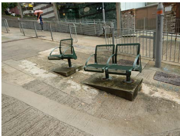
早前因耗損而需臨時移除的座椅