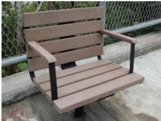
重置座椅式樣參考