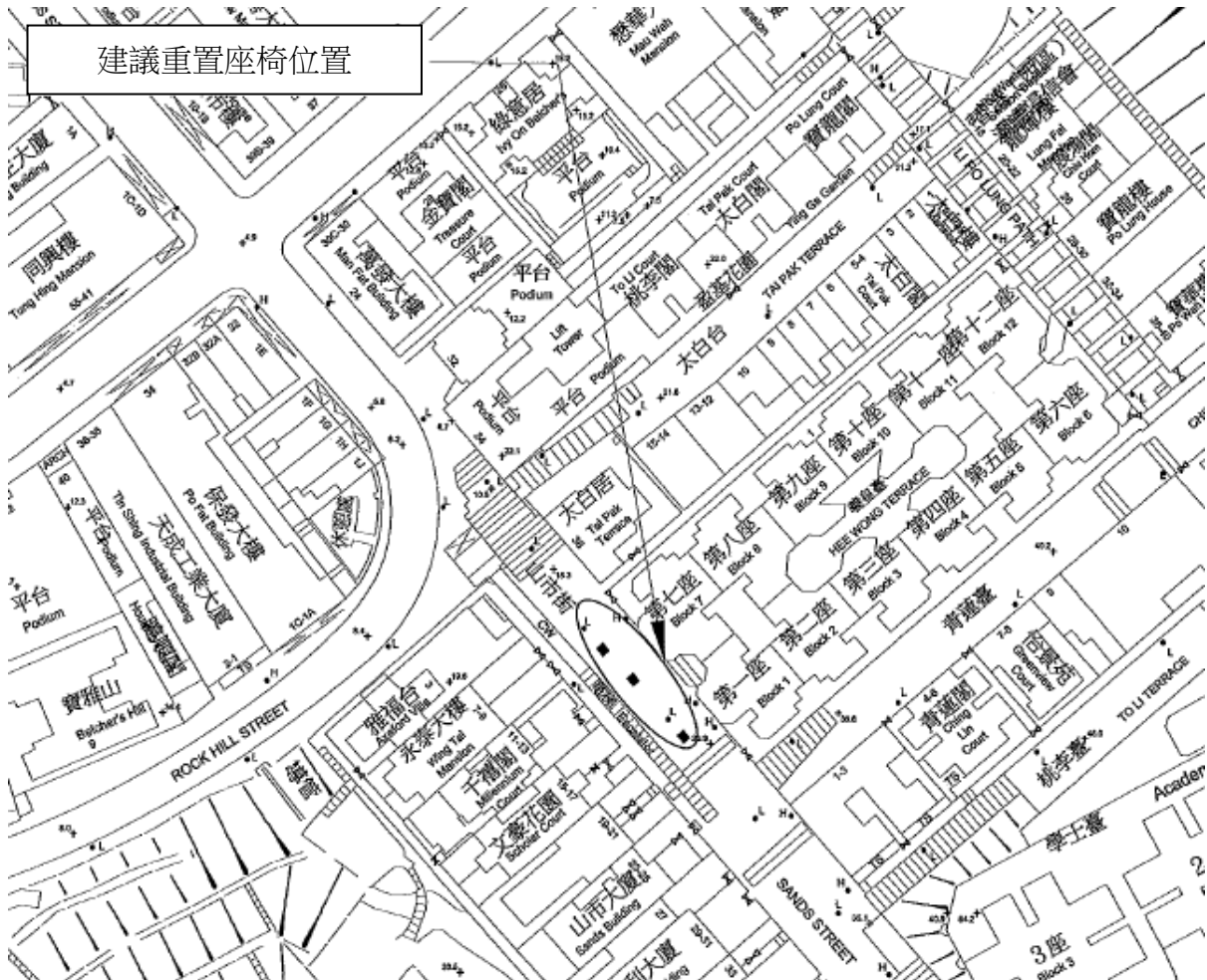
建議重置座椅位置