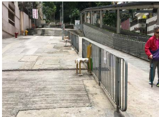
現場由附近居民臨時重置的座椅