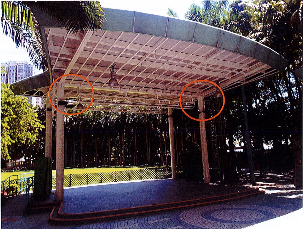
建議在紅圈位置添置電風扇