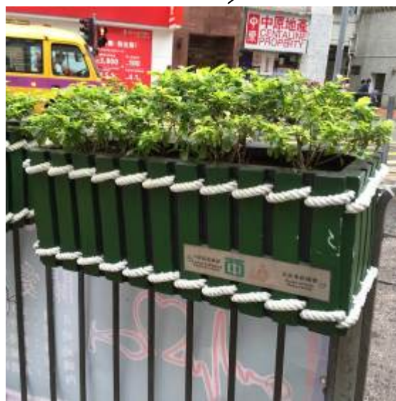
欄杆盆栽植物式樣