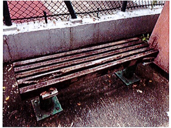
科士街臨時遊樂場休憩座椅，長期日曬雨淋已霉爛。