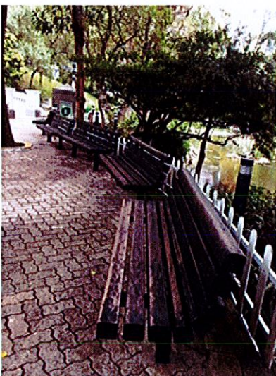
香港公園一帶休憩座椅，油漆剝落及有發霉的跡象。