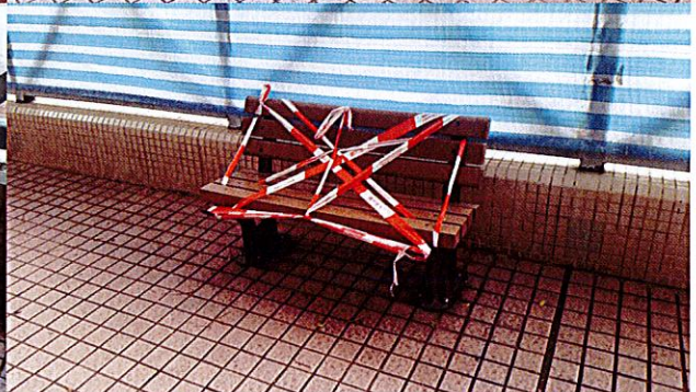
佐治五世紀念公園休憩座椅，損壞已久仍未更換。