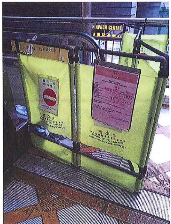
上圖為市民投訴近日因扶手電梯維修停用時造成樽頸位置上落不便的情況