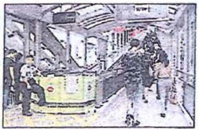
扶手電梯經常損壞及停用，工人只能使用狹窄樓梯搬貨上。

盧又指出，以載人扶手電梯搬貨品令機件故障，「載人扶手電梯長期承受運輸重量，齒輪難好易會斷，摩打都會負荷過重，老化程度亦會加快！」盧促當局加強培訓保安員及張貼明顯告示，減低故障及意外發生機會。