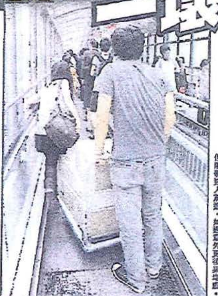
工人使用行人扶手電梯運送貨物，不但阻礙行人前進，如遇意外更後果堪虞。