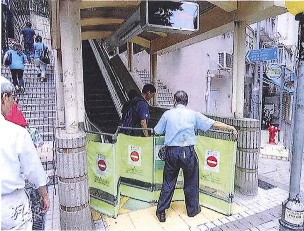
蒂森克虜伯的工潮暫未影響其緊急維修服務，中環至半山扶手電梯系統中的擺花街段及摩羅廟街段（圖）昨中午發生故障，蒂森的員工在 1 小時內到達現場檢查及維修。