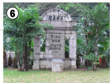
東華醫院拱門及其基石 Arch & Foundation Stone of Tung Wah Small Pox Hospital